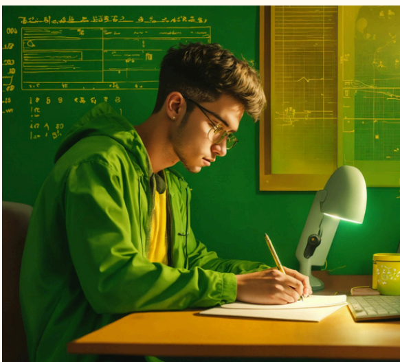
"Joven estudiando con inteligencia artificial"

El gran avance tecnológico y el desarrollo de la tecnología han permitido que la inteligencia artificial se pueda ir aplicando en el ámbito educativo y genere facilidades de aprendizaje y gestión de proyectos permitiendo que sea una herramienta bastante útil e innovadora para el proceso educativo y en diferentes áreas de nuestra vida cotidiana.