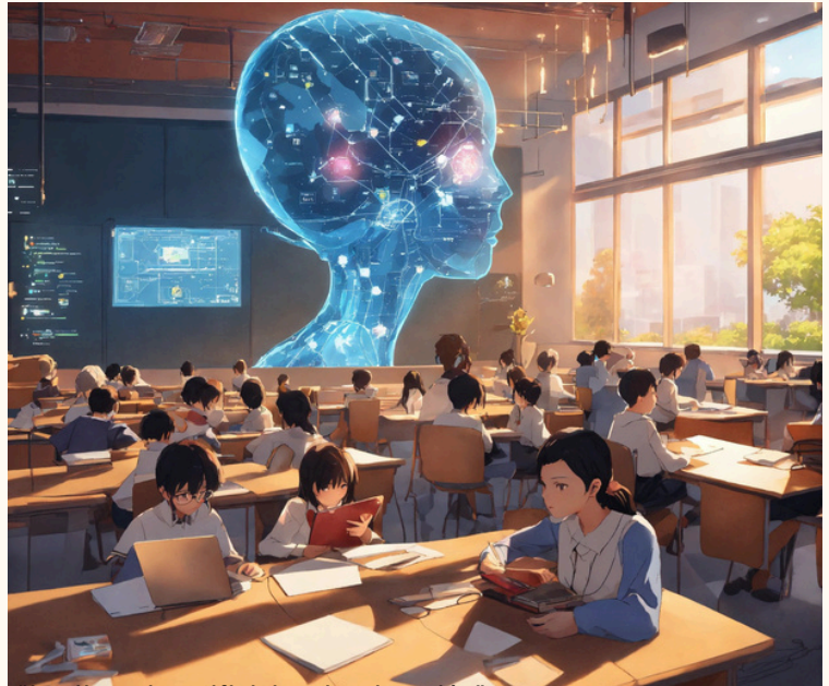
"Inteligencia artificial en la educación"

Fuente: https://lexica.art/prompt/b17b789b-b12a-4ac9-957a-64e396b4c590