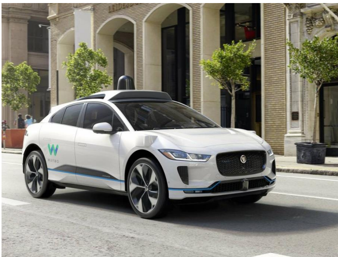
Automóvil I-Pace Jaguar autónomo paseando por las calles de San Francisco (California)

Se presentará una tecnología por cada una de las categorías seleccionadas y extraídas del radar de impacto propuesto por la empresa consultora e investigadora de tecnologías de la información “Gartner”, las categorías planteadas son: mundo inteligente, revolución de la productividad, privacidad y transparencia y facilitadores esenciales. (Perri, 2024)