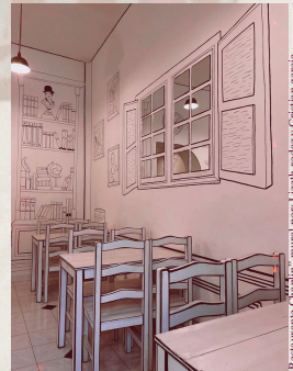
*Restaurante Chaplin- mural por: Lizeth rodaz y Cristian Garcia